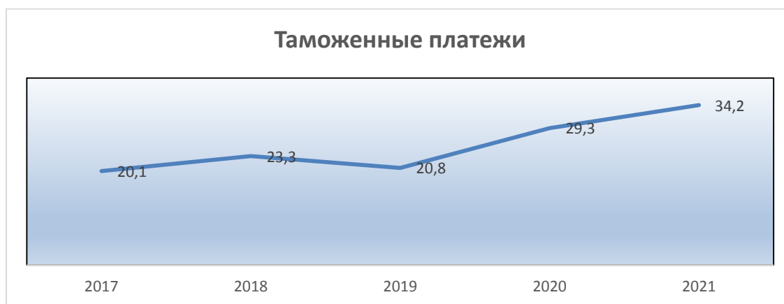
Рисунок 1 – Динамика таможенных пошлин из третьих стран за 2017-2021 гг.

Анализ динамики таможенных пошлин из третьих стран за 2017-2021 гг. каждым годом растет (рисунок 1) [17].