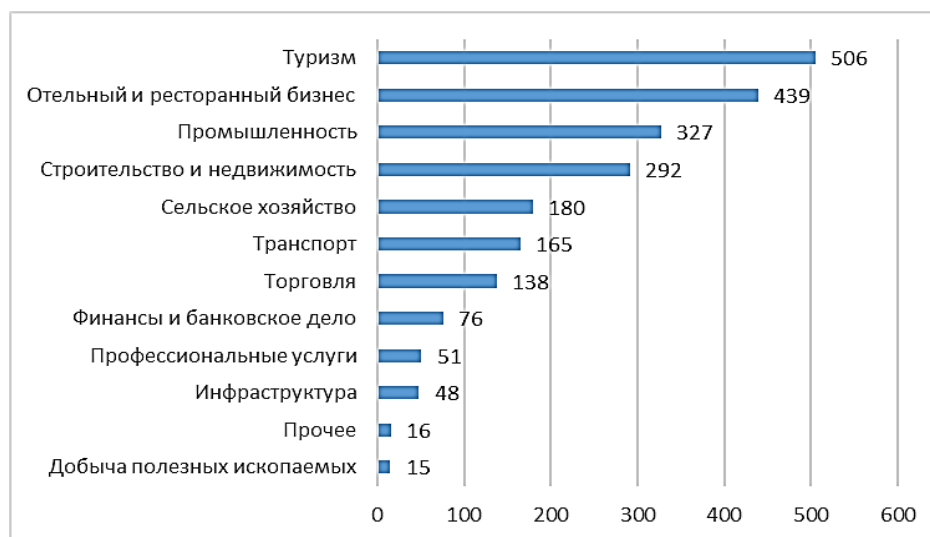
Рисунок 1 – Наиболее пострадавшие отрасли из-за COVID-19 в Южной Азии (кумулятивное средневзвешенное значение).

связанные с поставками одежды и обуви, изделий из бумаги и дерева, продуктов питания. Так рассматривая в качестве примера Южную Азию (рис. 1), можно увидеть, что наиболее пострадавшими от пандемии коронавирусами секторами экономики являются туризм, отельный и ресторанный бизнес – сектора в наибольшей степени зависящие от потоков людей, и промышленность – сектор в существенной степени зависящий от поставок из стран АТР.